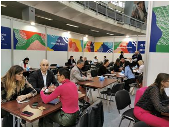
B2B susreti tokom Međunarodnog sajma turizma u Beogradu, februar 2023