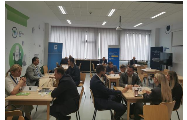
B2B susreti tokom Međunarodnog foruma o saradnji u Nišu, novembar 2023