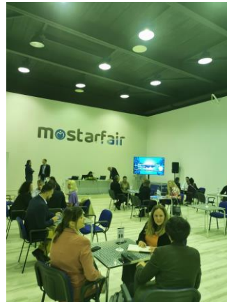
B2B susreti tokom Međunarodnog privrednog sajma u Mostaru, maj 2023